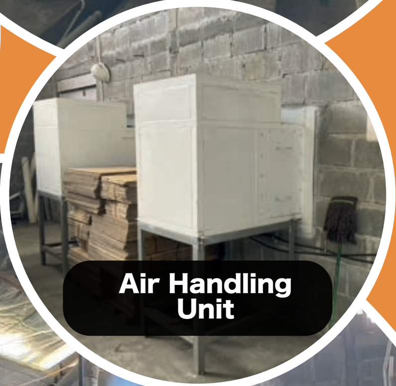
Air Handling Unit